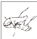
●ワイヤーカッターとして。