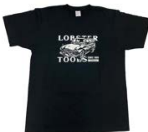
当社の昔の営業車がモデルとなった「レトロカーシリーズ」のNEWデザインが誕生しました!