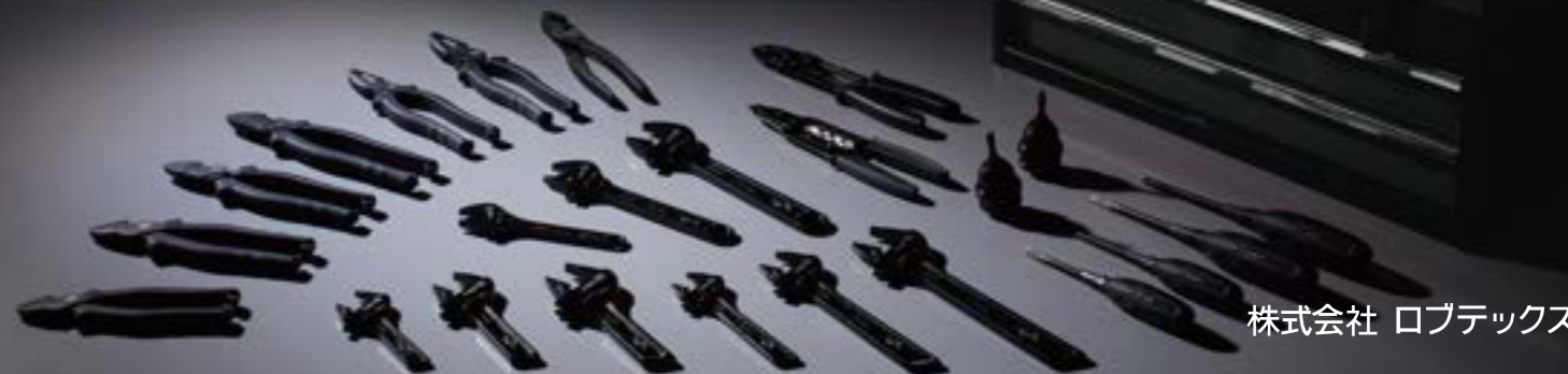
株式会社 ロブテックス